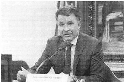
Deputado Darci de Matos é o relator da PEC dos Precatórios, que teve admissibilidade aprovada pela Comissão de Constituição e Justiça, na Câmara dos Deputados, na semana passada