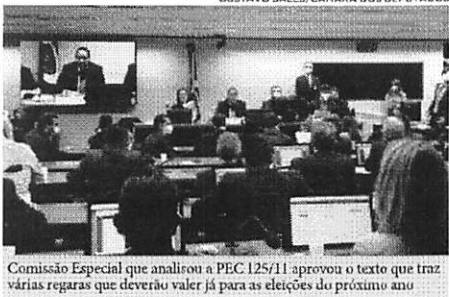
Comissão Especial que analisou a PEC 125/11 aprovou o texto que traz várias regras que deverão valer já para as eleições do próximo ano

O texto original da PEC 125/11 tratava apenas do adiamento das eleições em datas próximas a feriados, mas, no quarto substitutivo ao texto, a relatora incluiu vários temas a fim de “aumentar o leque de propostas” levadas para a apreciação do Plenário.