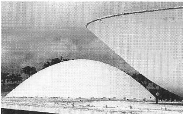
Medida Provisória que trata do novo Programa Emergencial de Manutenção do Emprego e da Renda foi aprovada pelo Plenário da Câmara dos Deputados

O texto-base aprovado pelo deputados também cria o Programa Primeira Oportunidade e Reinscrição no Emprego (Priore), direcionado a jovens entre 18 e 29 anos, no caso de primeiro emprego com registro em carteira, e a pessoas com mais de 55 anos sem vínculo formal há mais de 12 meses. O programa é semelhante ao Carreira Verde e Ananê, proposto com a MP 905/20, que perde a vigência sem ser votada. A remuneração máxima será de até dois salários mínimos, e o empregador poderá compensar com o repasse devido ao Sistema S até o valor correspondente a 11 horas de trabalho semanais por trabalhador com base no valor horário do salário mínimo. Pelo texto, a empresa poderá descontar até 15% das contribuições devidas ao sistema de aprendizagem (Sesi, Senai, Senac e outros). Esse percentual vale para o bônus desse programa e também do programa de requalificação (Requip).