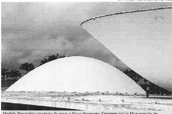
Medida Provisória que trata do novo o Novo Programa Emergencial de Manutenção do Emprego e da Renda foi aprovada pelo Plenário da Câmara dos Deputados

O programa é semelhante ao Carteira Verde e Amarela, proposto com a MP 905/20, que perdura a vigência sem ser votada. A remuneração máxima será de até dois salários mínimos, e o empregador poderá compensar com o repasse devido ao Sistema S até o valor correspondente a 11 horas de trabalho semanais por trabalhador com base no valor horário do salário mínimo. Pelo texto, a empresa poderá descontar até 15% das contribuições devida ao sistema de aprendizagem (Sesi, Senai, Senac e outros). Esse percentual vale para o bônus desse programa e também do programa de requalificação (Requip).