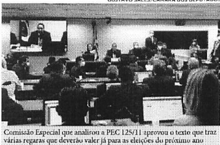
Comissão Especial que analisou a PEC 125/11 aprovou o texto que traz várias regras que deverão valer já para as eleições do próximo ano

O texto original da PEC 125/11 tratava apenas do adiamento das eleições em datas próximas a feriados, mas, no quarto substitutivo ao texto, a relatora incluiu vários temas a fim de “aumentar o leque de propostas” levadas para a apreciação do Plenário.