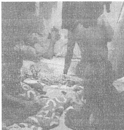
Maranhenses viviam em situação degradante e eram explorados, em Santa Catarina

Ministério da Economia. INVESTIGADOS Atualmente, quatro pessoas estão sendo investigadas por participação no caso. São eles: o proprietário da empresa, os responsáveis pelo transporte dos trabalhadores para Santa Catarina, e o suposto aliciador, que seria de natural de São Joaquim, mas mora em Santa Inês porque é casado com uma maranhense. Os endereços deles foram alvos dos mandados de busca e apreensão, que resultaram em apreensões de documentos, celulares e demais mídias digitais. Todo material passará por análise e, de acordo com a PF, deve ajudar a desbaratar mais pessoas envolvidas nesse e em outros crimes dessa natureza. Os investigados poderão responder por crimes de reduzir alguém a condição análoga à de escravo e de tráfico de pessoas, dentre outros, podendo as penas somadas chegarem a 16 anos de reclusão e multa. A operação foi denominada Finita Servus, termo oriundo do Latim utilizado no Império Romano, indicando o fim da escravidão.