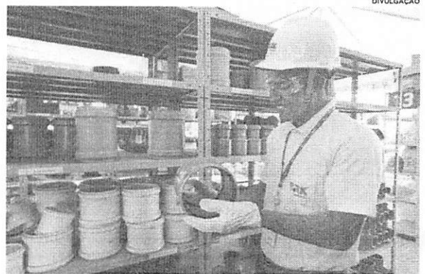
No Dia do Trabalhador, a BRK Ambiental homenageia as pessoas que trabalham em prol dos serviços essenciais de fornecimento de água e esgotamento sanitário em Ribamar e Paço

"Diante do cenário mundial da pandemia o setor do saneamento é fundamental para evitar a propagação da doença e neste Dia do Trabalho devemos valorizar todos os