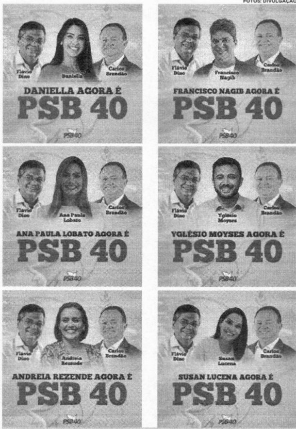
Alguns dos novos filiados ao Partido Socialista Brasileiro (PSB)