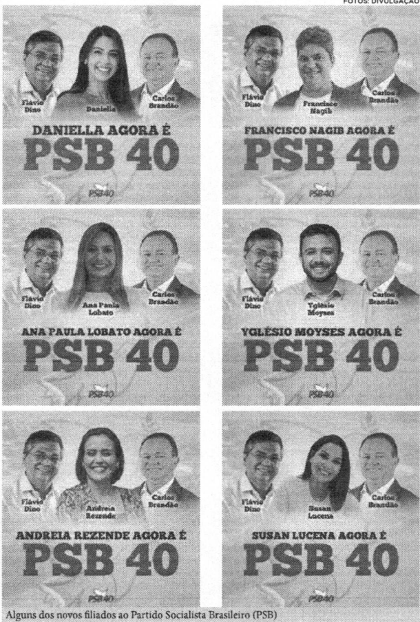
Alguns dos novos filiados ao Partido Socialista Brasileiro (PSB)