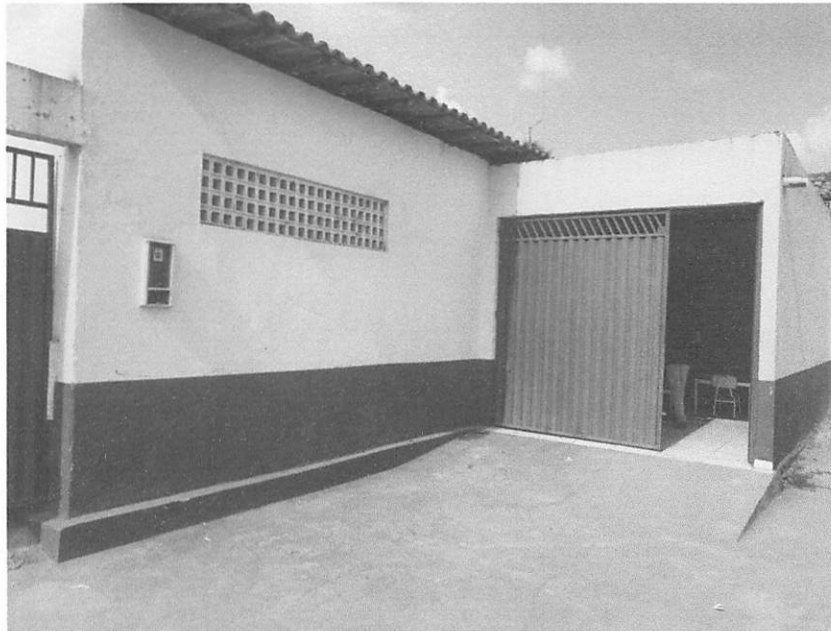
FRENTE DO IMÓVEL