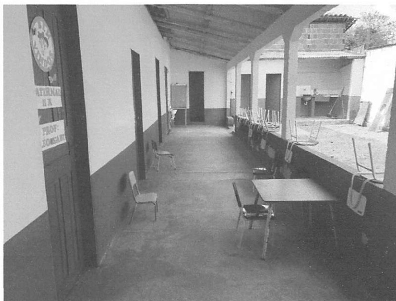
CIRCULAÇÃO EXTERNA PARA ACESSO AS SALAS