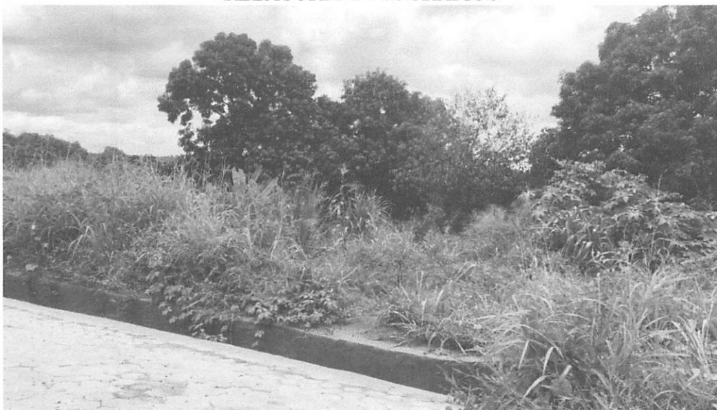
LOCAL DA ANTIGA RESIDÊNCIA