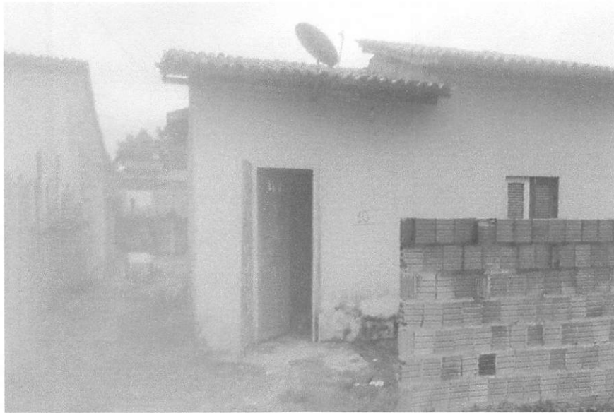
FRENTE DA CASA