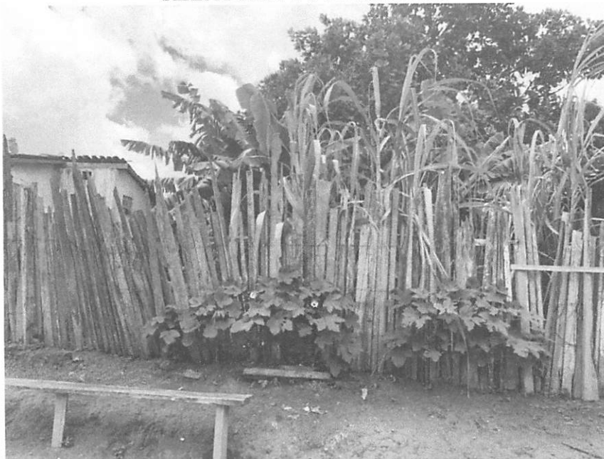
LOCAL DA ANTIGA RESIDÊNCIA