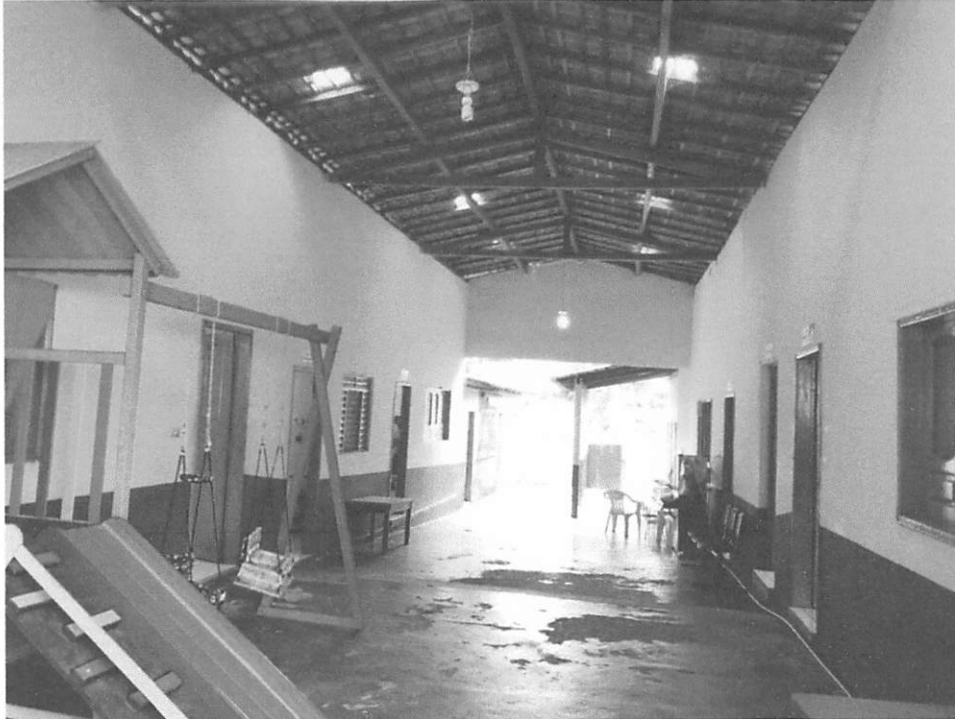
ÁREA DE CIRCULÃO EXTERNA

ESTADO DO MARANHÃO PREFEITURA MUNICIPAL DE BURITICUPU/MA RUA SÃO RAIMUNDO, Nº 01, CEP:65.393-000 – CENTRO – BURITICUPU/MA CNPJ Nº 01.612.525/0001-40