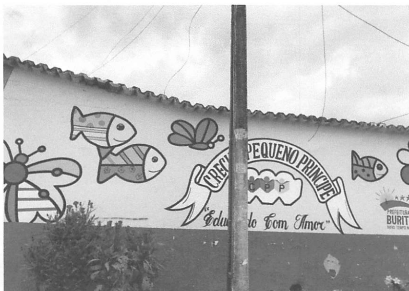
FRENTE DO IMÓVEL