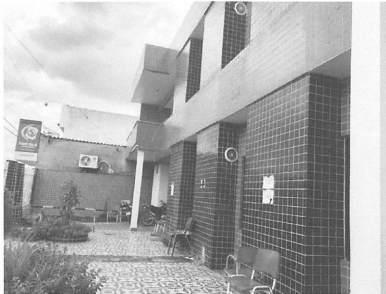
FRENTE DO PREDIO