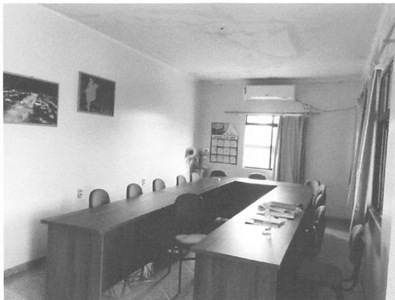
SALA DE REUNIÃO DA SECRETARIA

ESTADO DO MARANHÃO PREFEITURA MUNICIPAL DE BURITICUPU/MA RUA SÃO RAIMUNDO, Nº 01, CEP:65.393-000 – CENTRO – BURITICUPU/MA CNPJ Nº 01.612.525/0001-40