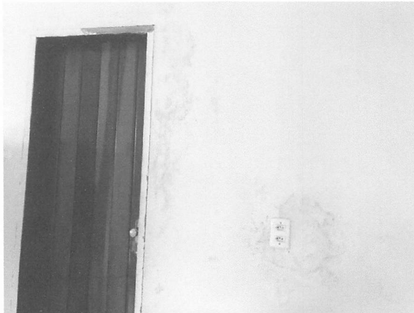
PAREDE DA SALA DA SECRETARIA DE EDUCAÇÃO

ESTADO DO MARANHÃO PREFEITURA MUNICIPAL DE BURITICUPU/MA RUA SÃO RAIMUNDO, Nº 01, CEP:65.393-000 – CENTRO – BURITICUPU/MA CNPJ Nº 01.612.525/0001-40