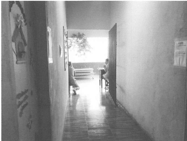
CIRCULAÇÃO EXTERNA PARA ACESSO AS SALAS