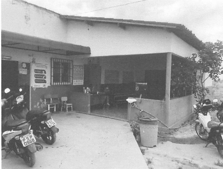
FRENTE DA IMOVEL