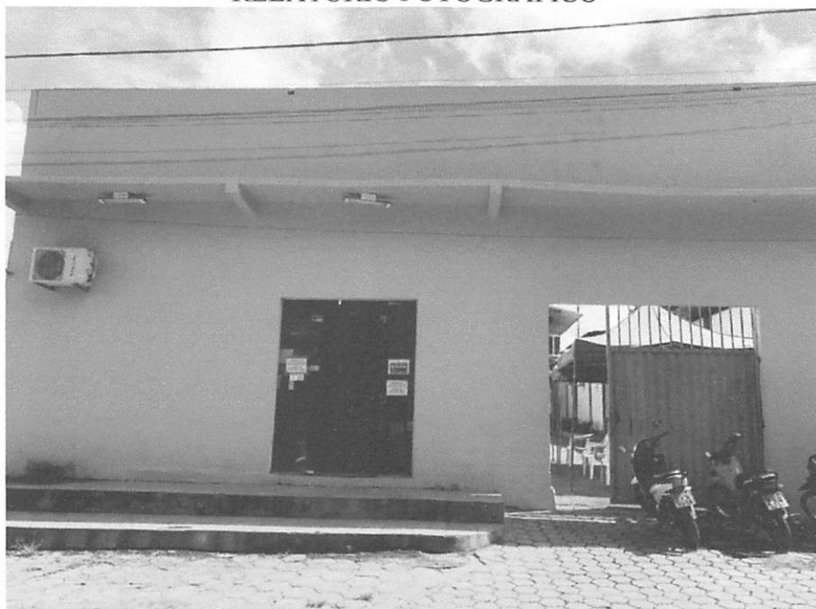
FRENTE DO IMÓVEL