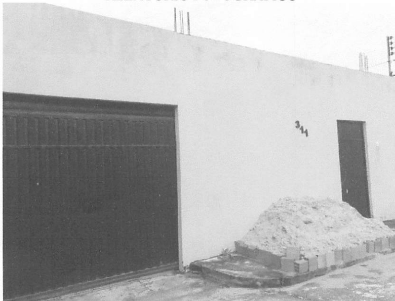
FRENTE DA CASA