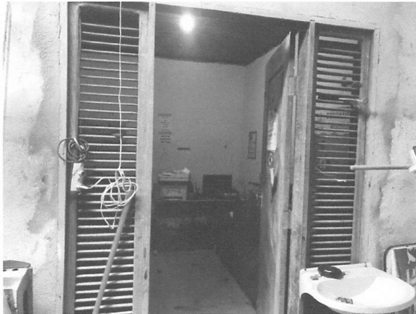
ENTRADA DA CASA