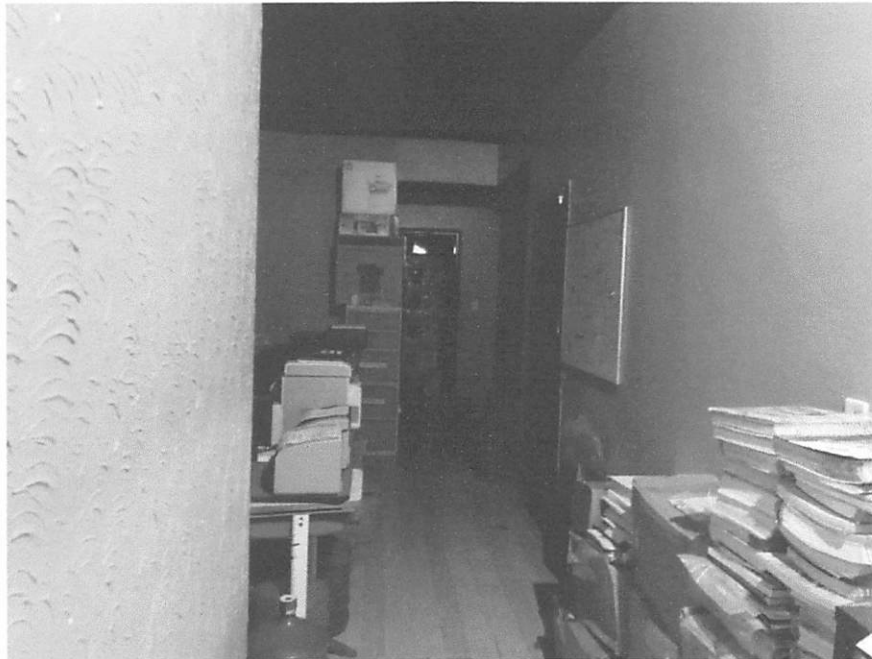
HALL DE CIRCULAÇÃO

ESTADO DO MARANHÃO PREFEITURA MUNICIPAL DE BURITICUPU/MA RUA SÃO RAIMUNDO, Nº 01, CEP:65.393-000 – CENTRO – BURITICUPU/MA CNPJ Nº 01.612.525/0001-40