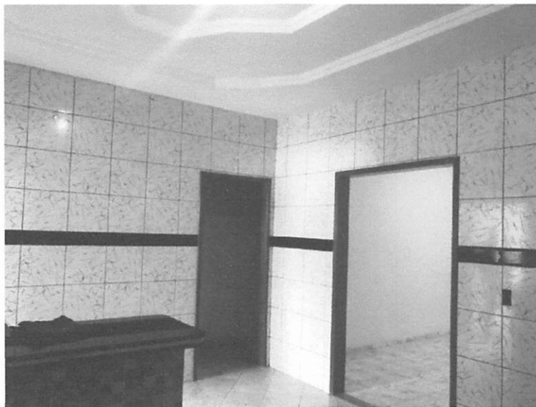
AREA DE CIRCULAÇÃO

ESTADO DO MARANHÃO PREFEITURA MUNICIPAL DE BURITICUPU/MA RUA SÃO RAIMUNDO, Nº 01, CEP:65.393-000 – CENTRO – BURITICUPU/MA CNPJ Nº 01.612.525/0001-40