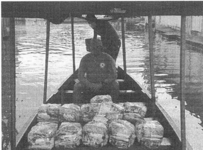
Corpo de Bombeiros realiza a distribuição das 3,9 mil cestas básicas para afetados pelas chuvas