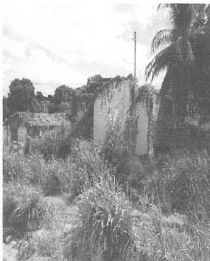
Ano de 2020