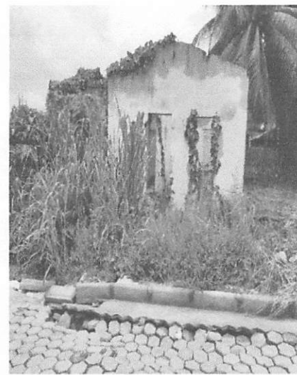
Ano de 2021