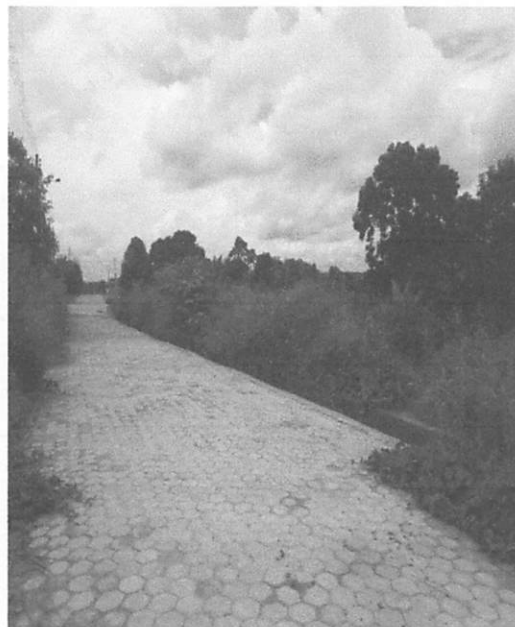
Ano de 2020 e 2021